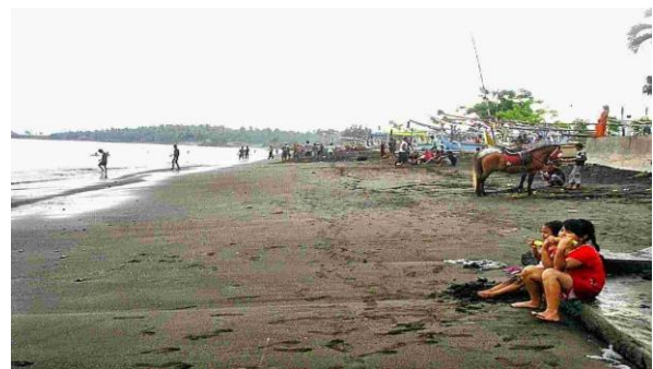
Gambar 2. Pantai Blimbingsari pada Masa Eksplorasi

Fase ini menjadi bagian penting dalam perjalanan Pantai Blimbingsari menuju bentuknya yang lebih terstruktur seperti saat ini. Sama seperti yang terjadi di berbagai daerah lain di Indonesia, lambatnya perkembangan daya tarik dan minimnya dukungan dari luar menjadi alasan mengapa kawasan seperti ini sempat bertahan cukup lama dalam tahap eksplorasi. Setelah itu, muncul upaya yang lebih terorganisir untuk menjadikannya sebagai bagian dari destinasi wisata yang lebih serius.